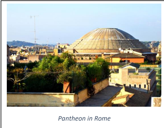
Pantheon in Rome

Anlage 1, Einstieg, „Europa. Unsere Geschichte“, Band 2, S. 248. Der Einfluss einer Italienreise auf das Chiswick House.