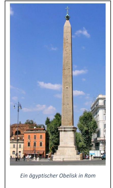
Ein ägyptischer Obelisk in Rom