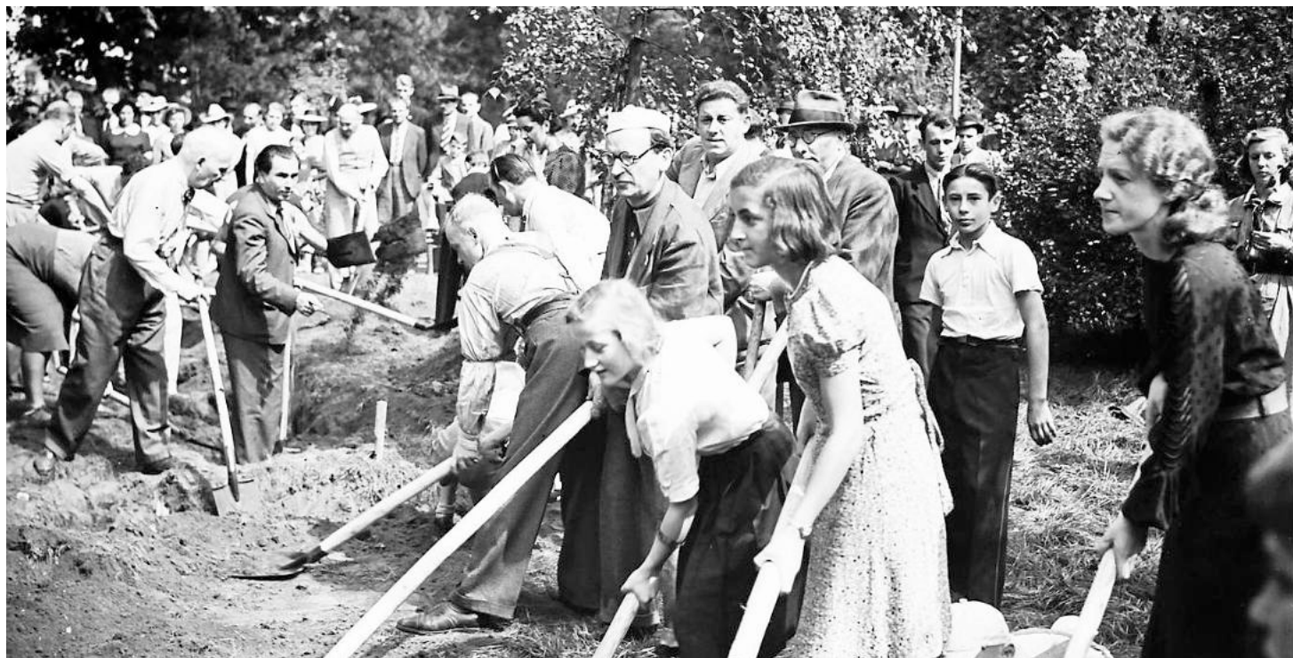
Krakowianie podczas kopania rowów przeciwlotniczych na Plantach https://plus.gazetakrakowska.pl/upalne-lato-1939-roku-ostatnie-dni-pokoju/ar/c15-14377255