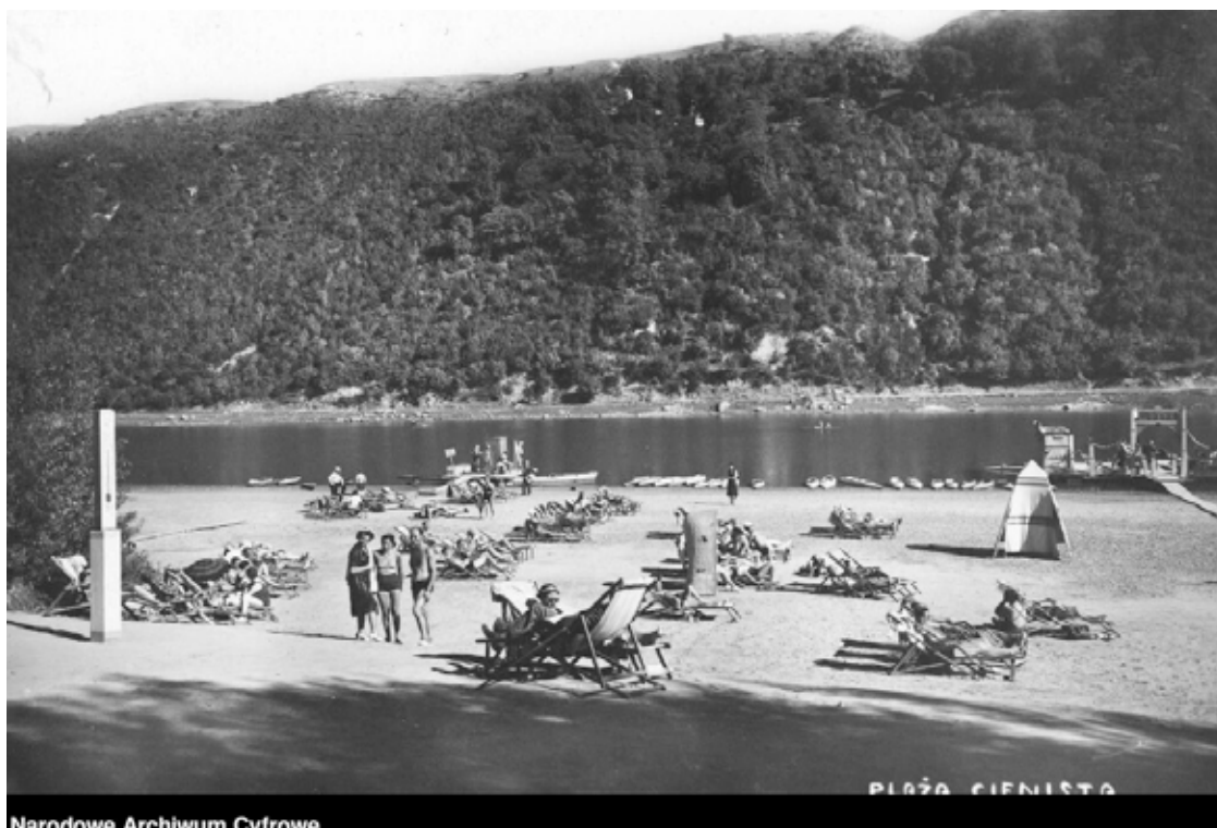
Plaża cienista w Zaleszczykach