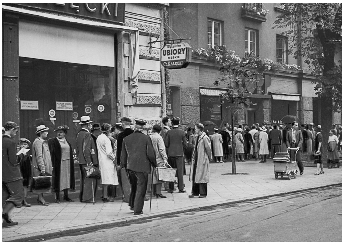
Sierpień 1939, Mieszkańcy Warszawy stojący w kolejkach do sklepów http://www.wrzesien39.waw.pl/kartka/ul-swieto-krzyska/1-w-3127_sm-2