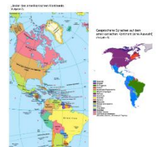
Anlage 1, Sprachen in Amerika

Impuls: „Nennt den Kontinent, von dem die Sprachen stammen?“ SchülerInnen erkennen eine kognitive Dissonanz und stellen erste Fragen. Sie stellen Vermutungen an, warum europäische Sprachen dort auftauchen.